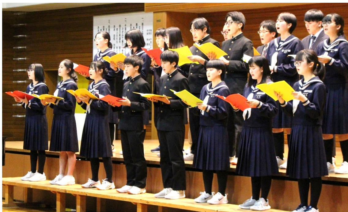
← 11月9日 ふるさと演芸会 全校合唱の様子

私を含め、誰にもよくあることです。自分のことは、自分が一番知っているはずですが。2学期の学習・生活を振り返り、自分の良かったことをより伸ばし、足りなかったことはもう少し頑張ろうという気持ちを持ち、12月を締めくくりましょう。